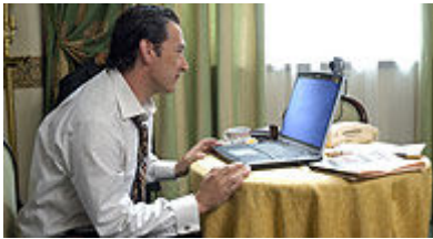
Una escena de 'Hotel Tivoli'.

'Hotel Tívoli' es una comedia que habla de pasión, "por esto además de ser irónica y sarcástica, tiene una parte de amargura". "Es una película dedicada a las mujeres , que son las que tienen el punto de vista más sano y hacen que el mundo vaya mejor", ha comentado el cineasta.